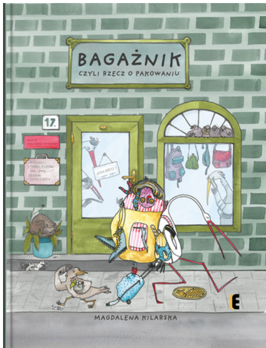
Okładka książki Magdaleny Kilarskiej